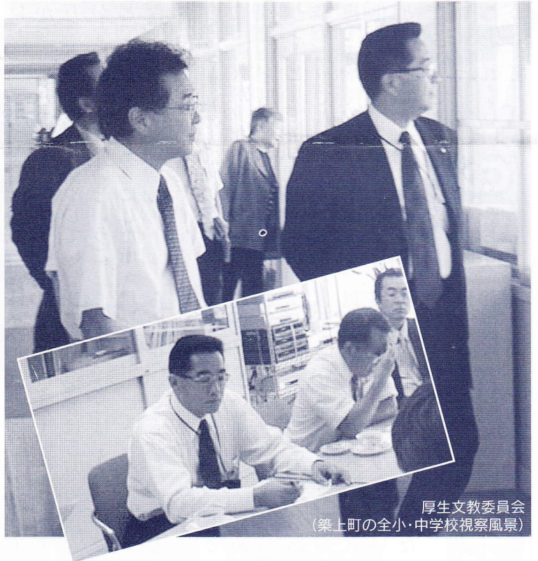
厚生文教委員会 (築上町の全小・中学校視察風景)

度の低さを感じます。話を覚えて、二期目に突入り早や五ヶ月、私は「一生懸命」をキャッチフレーズに二期目を当選させていただきました。何に一生懸命なのか、築上町全般の事は言うまでもありませんが、私達議員には執行権はなく議員には議決権があります。町の行財政の運営上独断専行しないために両権限を均衡させ住民の福祉の向上を目指していかなくてはなりません。また議決権とは別に議員個人としてのビジョンとしては、このPMAクラブの最終ページに今昔・中津街道を毎回連載しています、築上町の歴史・文化・習慣等々を大切に「中津街道街づくり」を考え街道以外でも歴史文化を子供から大人まで歴史文化を感じる事が出来る街づくりを、皆様と一緒に考えて参りたいと思っております。