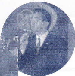
活発な意見交換で盛り上がった懇親会

4月22日の後援会総会には多数のご出席をいただきまして誠にありがとうございました。当日は、日頃からお世話になっております皆様と一同にお会いしての楽しいひとときをすごすことができました。また、色々な方から町政に対するご要望やご質問をいただき町議として責任を改めて認識いたしました。選挙も間近かに迫りましたがどうか皆様のお知り合いの方にも支援の輪を広げていただきますようお願い申し上げます。拝